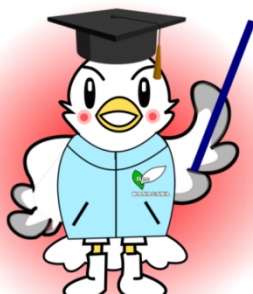
指導者養成委員会