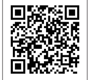
サーチウォークホームページ